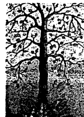
L'Albero delle Molte Vite Associazione Oncologica del Litorale